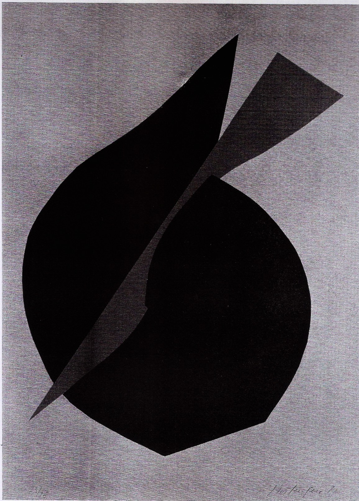
Richard Mortensen. Eroica I , 1971. Serigrafia, cm. 74,5x56.