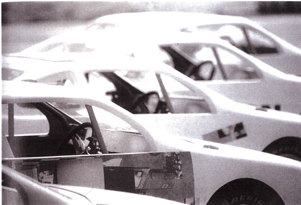
Peter Bonde & Jason Rhoades The Snowball / La palla di neve 1999 installazione, dimensioni varie